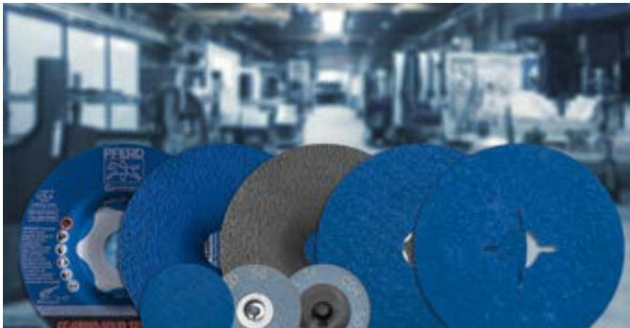
Bild 1 Leistungsfähig wie kein anderes Schleifmittel - VICTOGRAIN von PFERD

Anzahl Zeichen 3.766 (inkl. Leerzeichen)