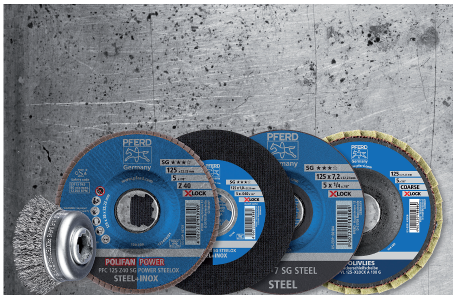
Photo 1 PFERD propose un programme complet d'outils équipés de supports X-LOCK.

Nombre de caractères 1 728 (avec espaces)